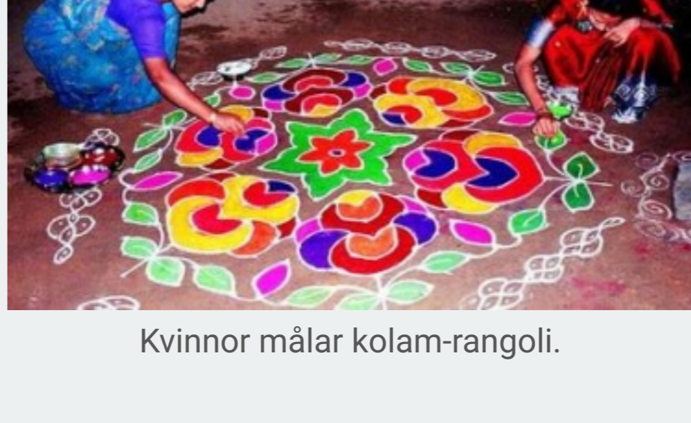
Kvinnor målar kolam-rangoli.